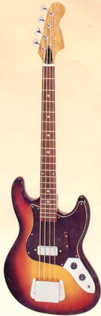
1902 nicht lieferbar