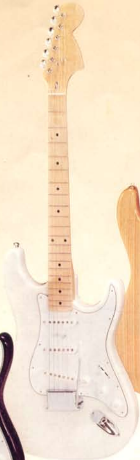
1940W DM 410,—