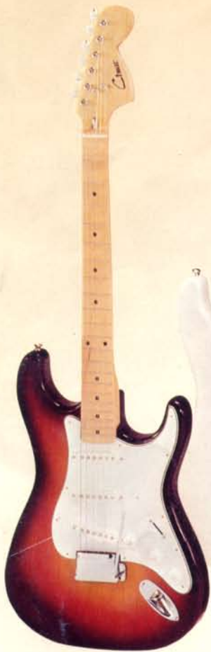
1940 DM 388,—