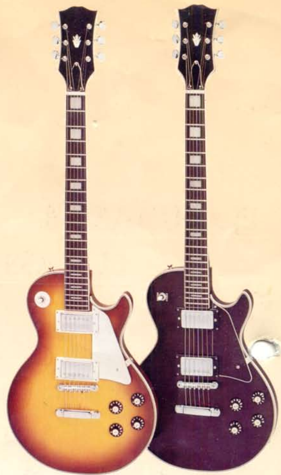
1904S DM 370,—