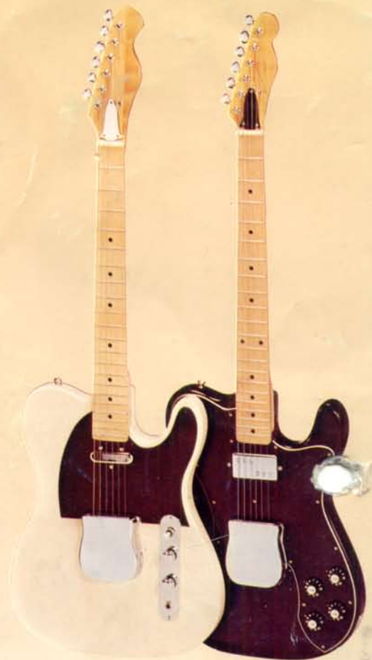
1943 DM 296,—