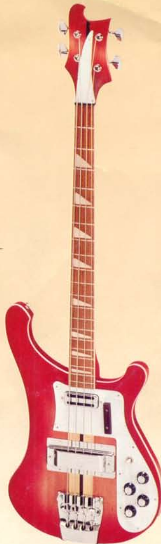
1949 DM 688,—