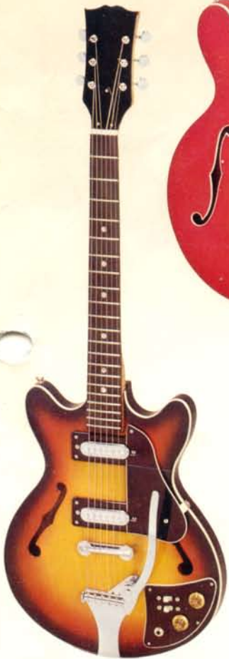
1909 DM 290,—