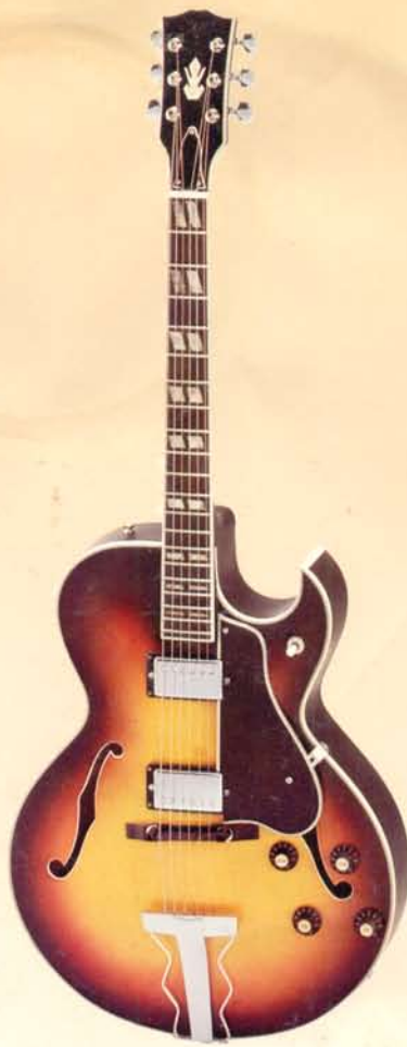
1948 DM 590,—