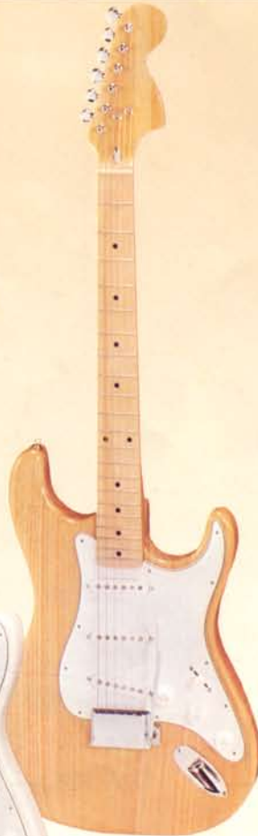
1940ASH DM 430,—