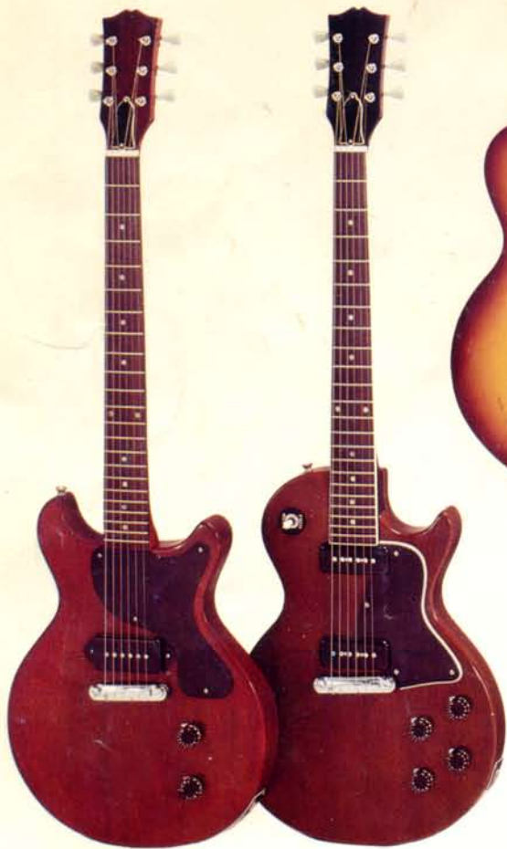
1941 DM 340,—