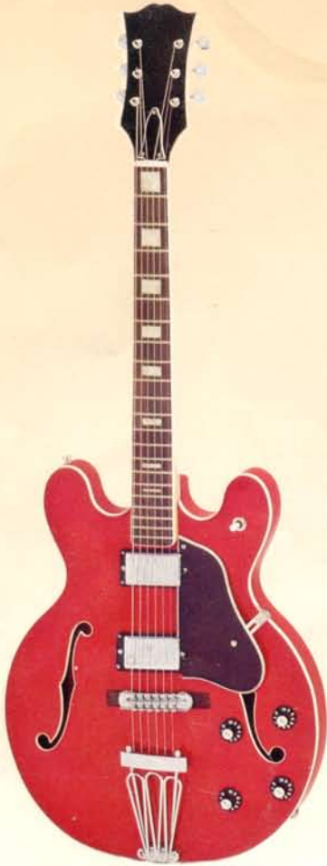
1947 DM 444,—