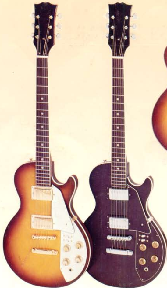
1903S DM 314,—