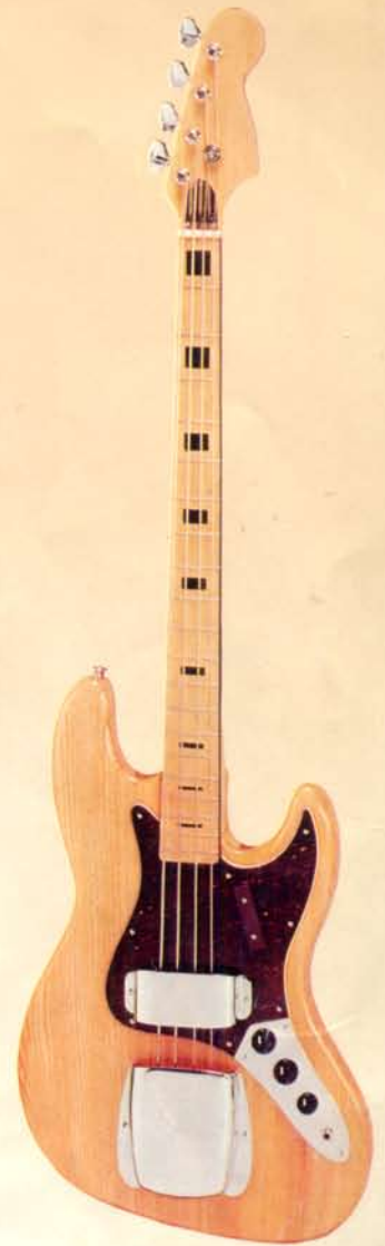
1908ASH DM 395,—