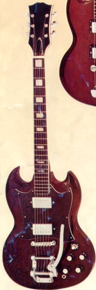
1944 DM 360,—