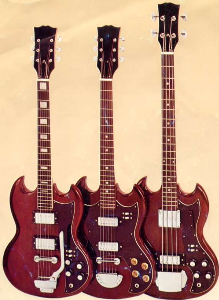
1906 DM 278,— 1905 DM 238,— 1907 DM 296,—