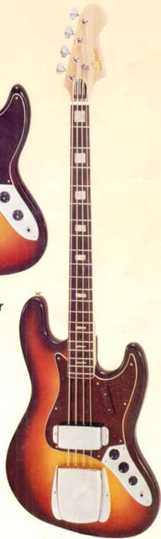
1908 DM 342,—